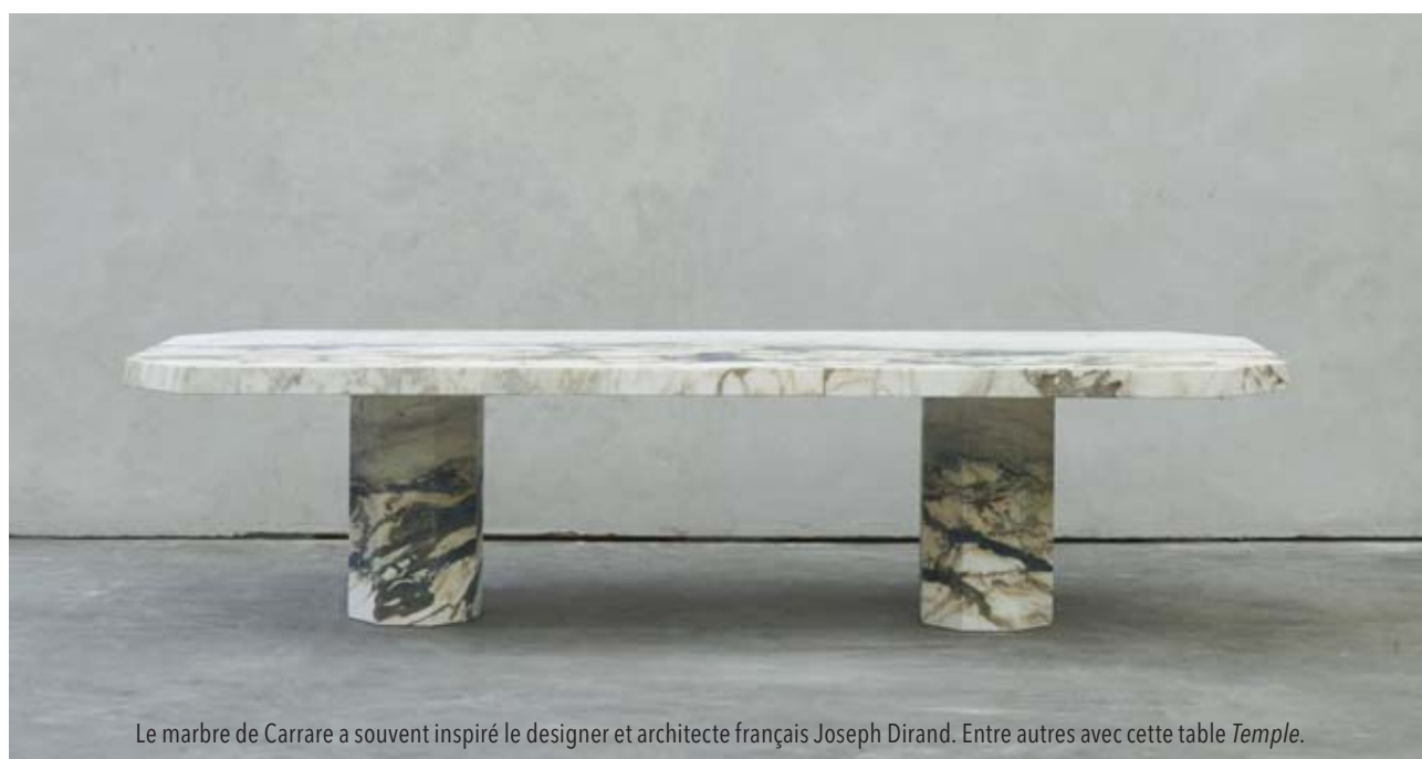
Le marbre de Carrare a souvent inspiré le designer et architecte français Joseph Dirand. Entre autres avec cette table Temple .