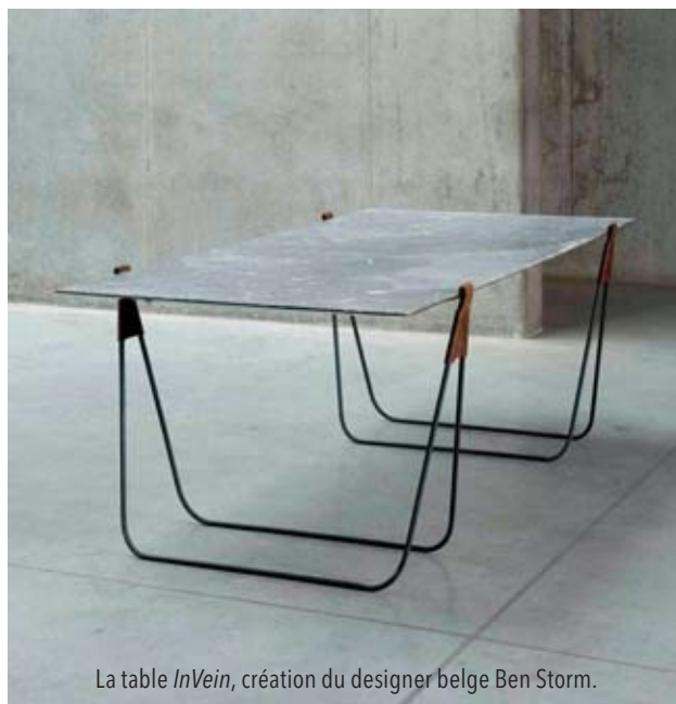
La table InVein , création du designer belge Ben Storm.

on en trouvera demain. Les richesses de la terre sont infinies , conclut-il en nous précisant fièrement que sa société est le dernier grossiste de Wallonie dans le secteur de la pierre naturelle. A le voir déambuler en veste kaki entre ses précieuses tranches de marbre, on l'imagine facilement dans l'habit d'un aventurier. Un aventurier un peu poète qui, avant de s'éloigner, ajoute : Le marbre est fragile et parfois intimidant, c'est vrai, mais... on lui pardonne tout! ☘