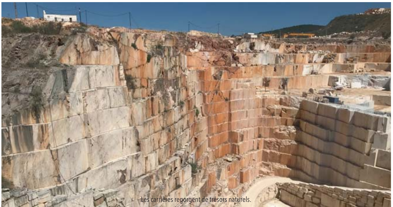
Les carrières regorgent de trésors naturels.

On le retrouve ensuite dans les églises, les restaurants, les monuments, mais aussi les halls d'entrée, les salles de bains et les cuisines des particuliers. De plus en plus de décorateurs misent sur de grandes tranches de marbre entières placées dans les cuisines en guise de crédence. Lorsque le marbre affiche une infinité de couleurs ou un jeu de